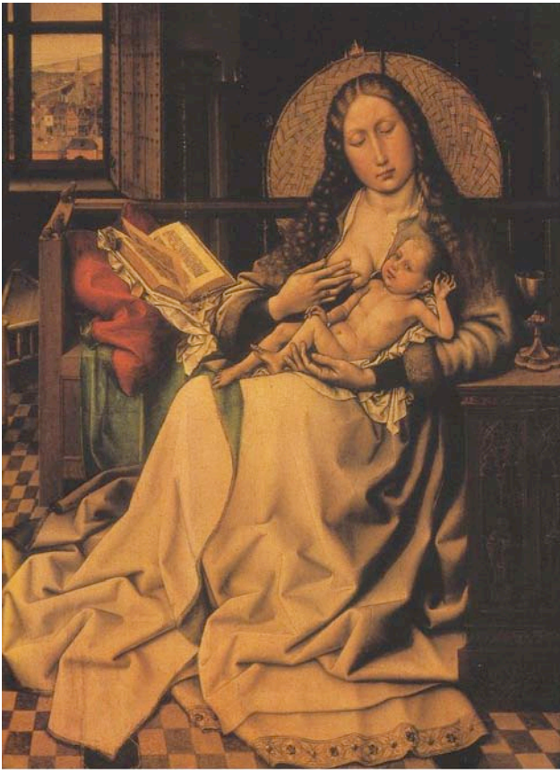
Robert Campin, La vierge à l'écran d'osier , 1425-1430, Tempera sur panneau