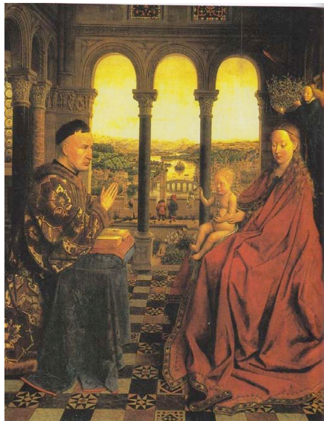
Jan Van Eyck, La Vierge du chancelier Rolin ou Vierge d'Autun , 1435, huile sur panneau