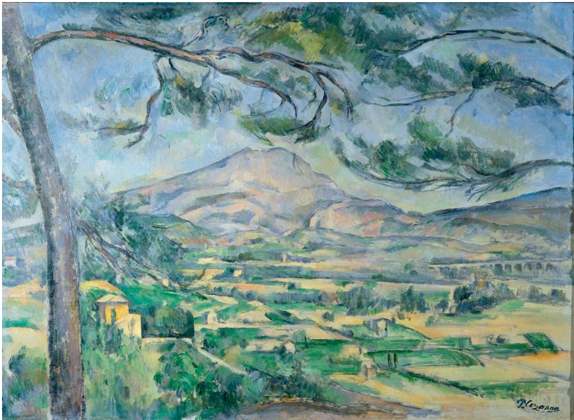
Paul Cézanne, Sainte Victoire, 1887, huile sur toile