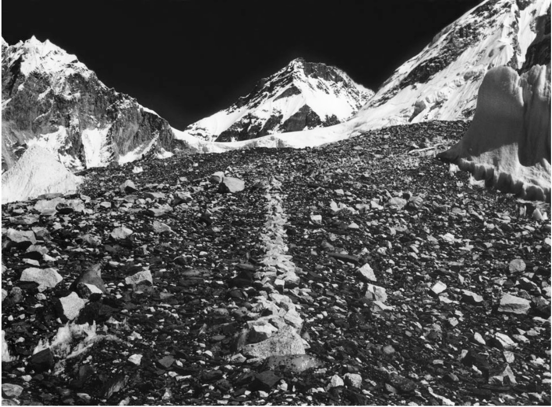
Richard Long, A line in the Himalaya, 1975