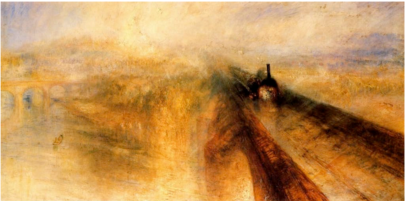
William Turner - Pluie, Vapeur, Vitesse - 1844