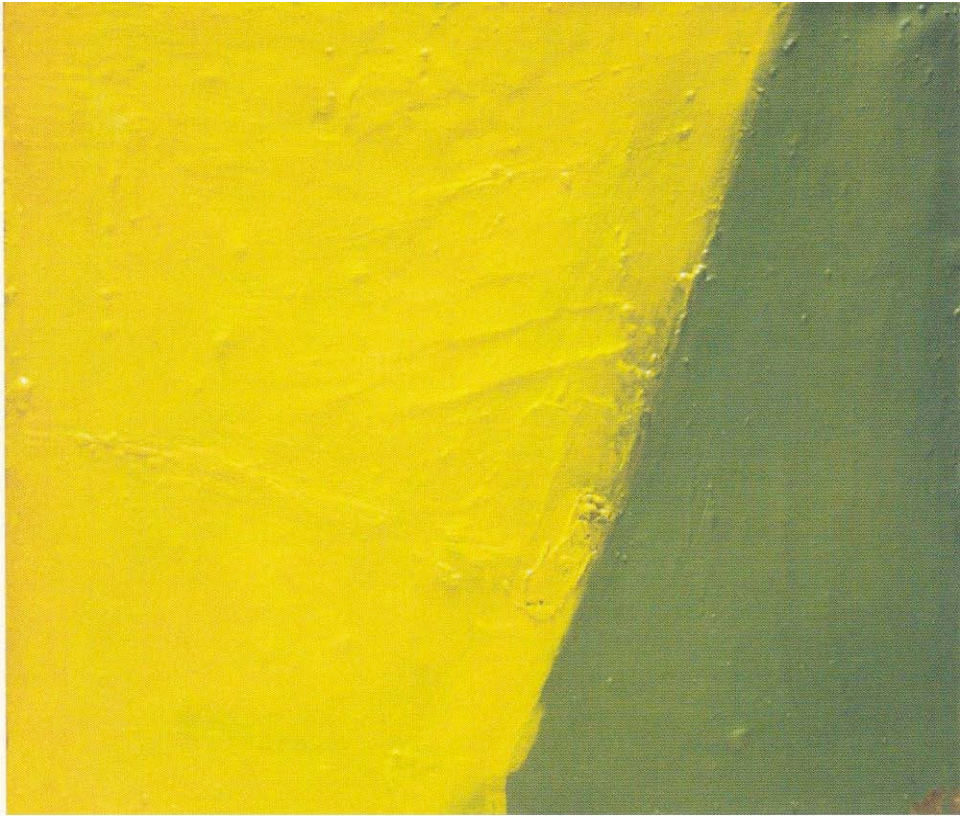
Pierre Tal-Coat, Sans titre, 1975-1982