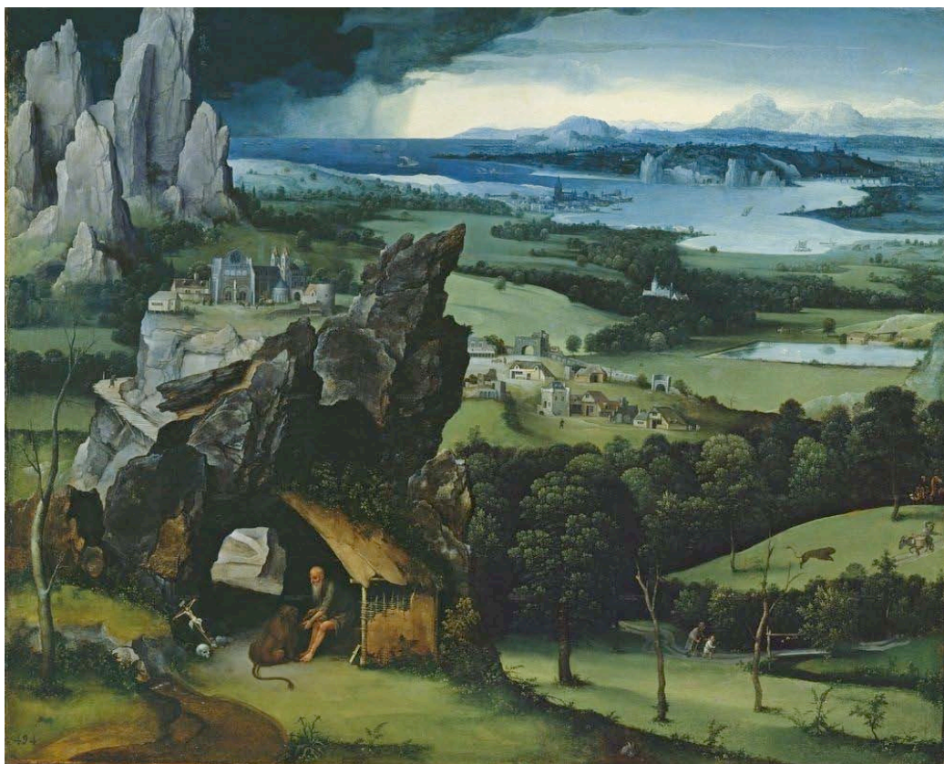
Patinir, Saint Jerome dans un paysage rocheux, 1520, huile sur panneau