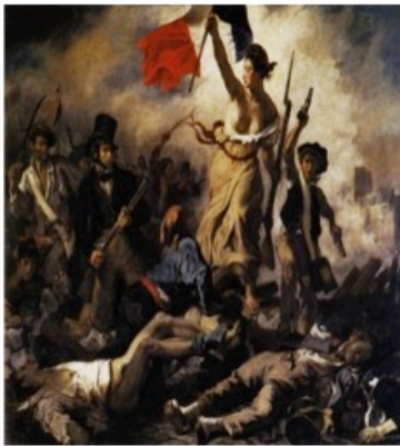
Eugène DELACROIX, La Liberté guidant le peuple (28 juillet 1830), huile sur toile 260 cm X 325 cm, Le Louvre, Paris.